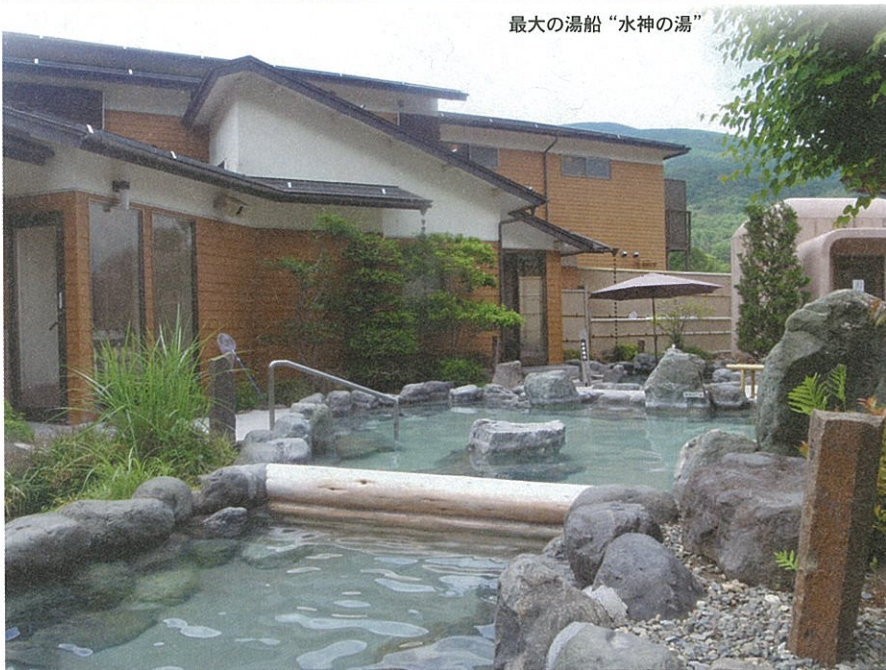
最大の湯船“水神の湯”

は思いのほか立派。外観だけでなく館内には食事処やリラクゼーション、休憩室も完備しており、ちよつとした都市型スーパー銭湯並みの充実度。ここまでの施設は想像していなかった。正直なところ入浴料はちよつと割高に思っていたのだけれど、これだけ付帯設備が揃っているならむしろ妥当なレベルと思直す。 とはいえお目当ては温泉のみ。充実設備には脳目も振らずまっしぐらに浴場に向かうと、そこもまた今どき仕様の端正な造り。湯船の構成の異なる東西の浴場を男女日毎に交替しているようで、この日の男湯は西側。内湯にはヒノキで縁取った湯船