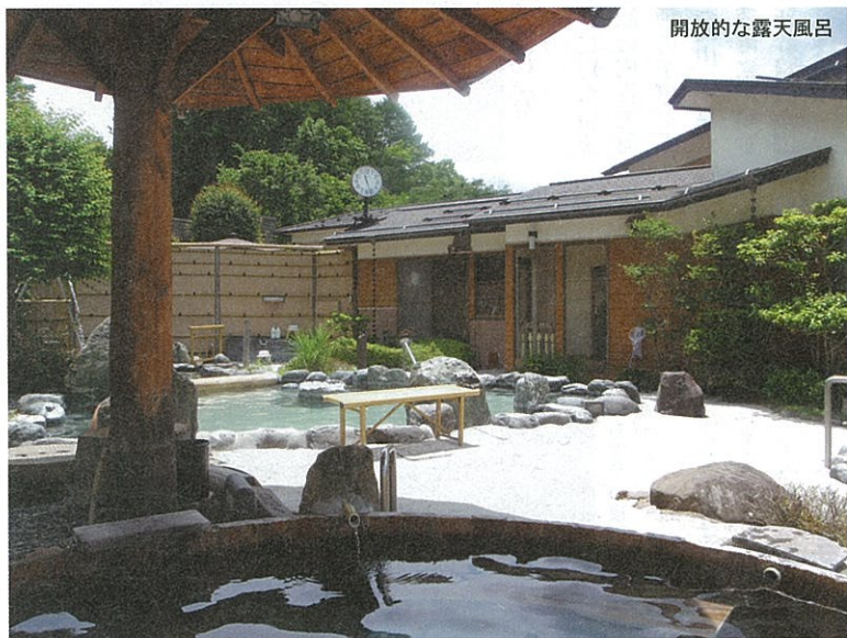
開放的な露天風呂

は思いのほか立派。外観だけでなく館内には食事処やリラクゼーション、休憩室も完備しており、ちよつとした都市型スーパー銭湯並みの充実度。ここまでの施設は想像していなかった。正直なところ入浴料はちよつと割高に思っていたのだけれど、これだけ付帯設備が揃っているならむしろ妥当なレベルと思直す。 とはいえお目当ては温泉のみ。充実設備には脳目も振らずまっしぐらに浴場に向かうと、そこもまた今どき仕様の端正な造り。湯船の構成の異なる東西の浴場を男女日毎に交替しているようで、この日の男湯は西側。内湯にはヒノキで縁取った湯船