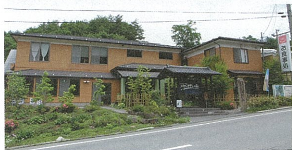
スキー場手前の坂の途中に建つ

いるではないですか！ 強烈なインパクトはないものの、それぞれの特徴が控えめにバランスされた湯は全身を優しく包み込み、しほし至福のひとつときを過ごさせてくれました。 さほど期待していなかっただけに、思わぬ良泉との出逢いは感激もひとしお。今後は、近くを通りかかるたびに、立ち寄るかどうか悩むことになりそうです。